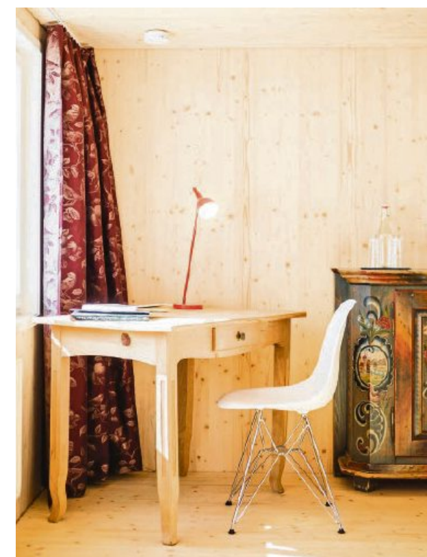
Stilvoll eingerichtet: Die Zimmer des Laui Ennetbühl. SANDRA ARDIZZONE